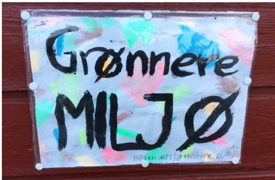
SKRIFTEN PÅ VEGGEN: For å bedre klima og miljø, må kommunen gå fra ord til handling.

«Når kommunen ikke klarer å være konkret, kan en ikke forvente at næringslivet og den grønne næringen skal være det.»