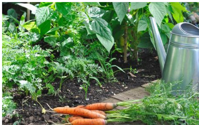
MATNYTTIG: Barn lærer godt ved å gjøre.

Skolehager legger til rette for opplevelser som barna tar med seg gjennom livet. Det å se et frø og følge planten mens den vokser og blir til mat, er en revolusjonerende oppdagelse for mange barn. Ved å jobbe med både kompost og dyrking blir barna våre kjent med naturens sykkluser. Skolehagen kan lære elevene konkret om kretsløp, resirkulering og om å ta vare på matjord gjennom kompostering, som også er et klimatiltak. Gleder over fysisk aktivitet, utforskning og