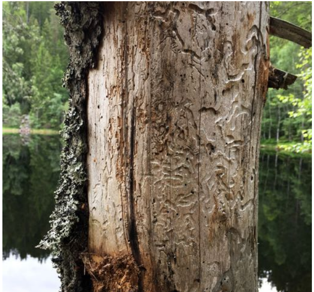
GAMMEL OG GOD: Naturopplevelsen skal ikke undervurderes og må tas hensyn til når man drifter skogen.

En skog som er i biologisk balanse, det vil si at samspill mellom alle arter foregår på naturens premisser, vil være lungene i vårt lille univers. En slik skog har evnen til å binde og over tid lagre store mengder CO 2 og andre klimagasser. Det er verdt å merke seg at skogbunnen binder opptil fem ganger så mye CO 2 som trærne. Dette ved hjelp av et fascinerende samspill mellom forskjellige mikrober, sopper og planter. Vi kaller det en synergieffekt. Dessuten bindes det mengder med nitrogen som er viktig for plantenes vekst. Ved moderne drift, hvor større flater blottlegges helt, vil det på kort tid frigjøres mengder med CO 2 og nitrogen – stikk i strid med intensjonene. Vi snakker om hvor mye CO 2 som kan bindes i treet i dets levetid, og at ved raskere sirkulering mellom planting og hogst, så vil denne bindingen gå i pluss, altså binde mer enn den frigjør av klimagasser. Dette blir på mange måter feil fordi helhetsbildet ikke er med i en slik fremstilling.