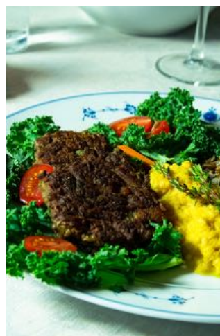
GRØNT OG SKJØNT: Linsekaker.