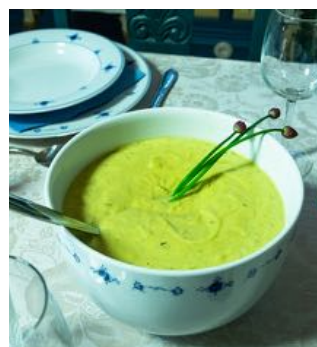
ENKEL FRISTELSE: Blomkålsuppe.