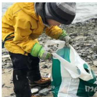
PLUKK OPP: Plast på avveie skader hele næringskjeden.