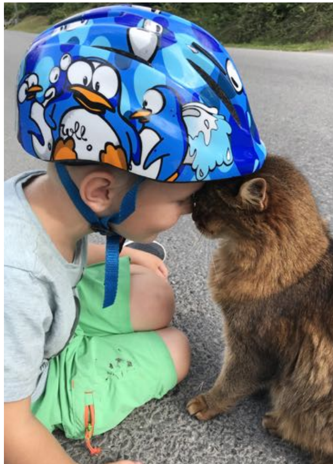
KATTEKOS: Dyr og mennesker har glede av hverandre

Landbrukskontoret kan formidle kunnskap om hvordan innrette driftens slik at ku og kalv får gå sammen, at eventuelt grisehold kan driftes ute på friland, om hvordan starte med høner og haner i hagen. Vi kan signalisere til bygdas innbyggere at «Ja, Nittedal er ei grønn bygd, så her kan du ikke klage på hanegal og andre dyrelyder.» Vi skal heie på dem som lar høneflokken beholde hanefar, som ruger ut høner hjemme i rugemaskin eller lar hønene gjøre det på egenhånd. Da unngår vi at folk kjøper egg fra kommersiell drift der praksisen er at alle en dag gamle haneekyllinger kvernes eller gasses. Noen jegere og jaktlag praktiserer strengere regler enn andre med tanke på dyrevelferd. Disse skal vi lære av og sørge for at slik praksis blir gjennomført i alle