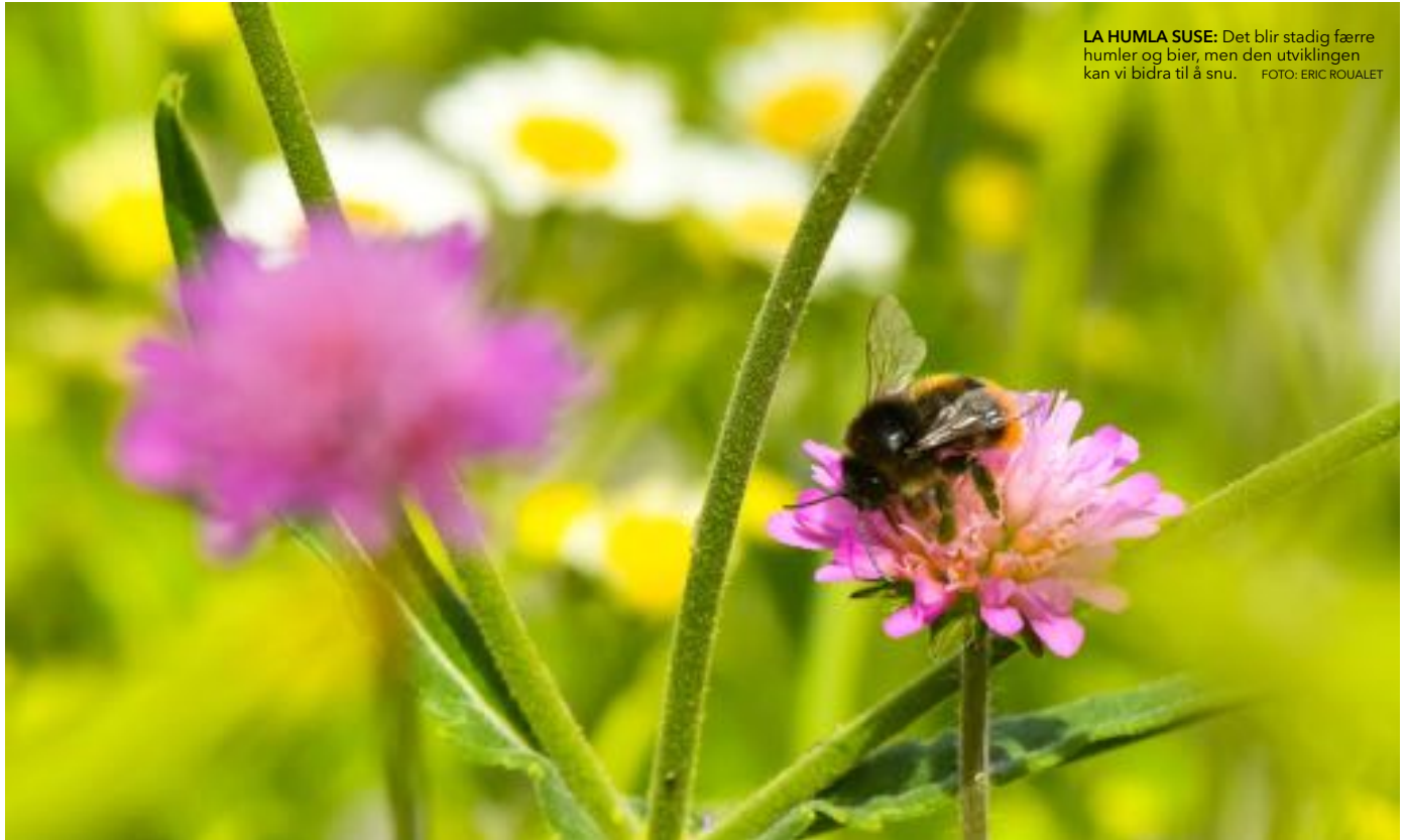
LA HUMLA SUSE: Det blir stadig færre humler og bier, men den utviklingen kan vi bidra til å snu.