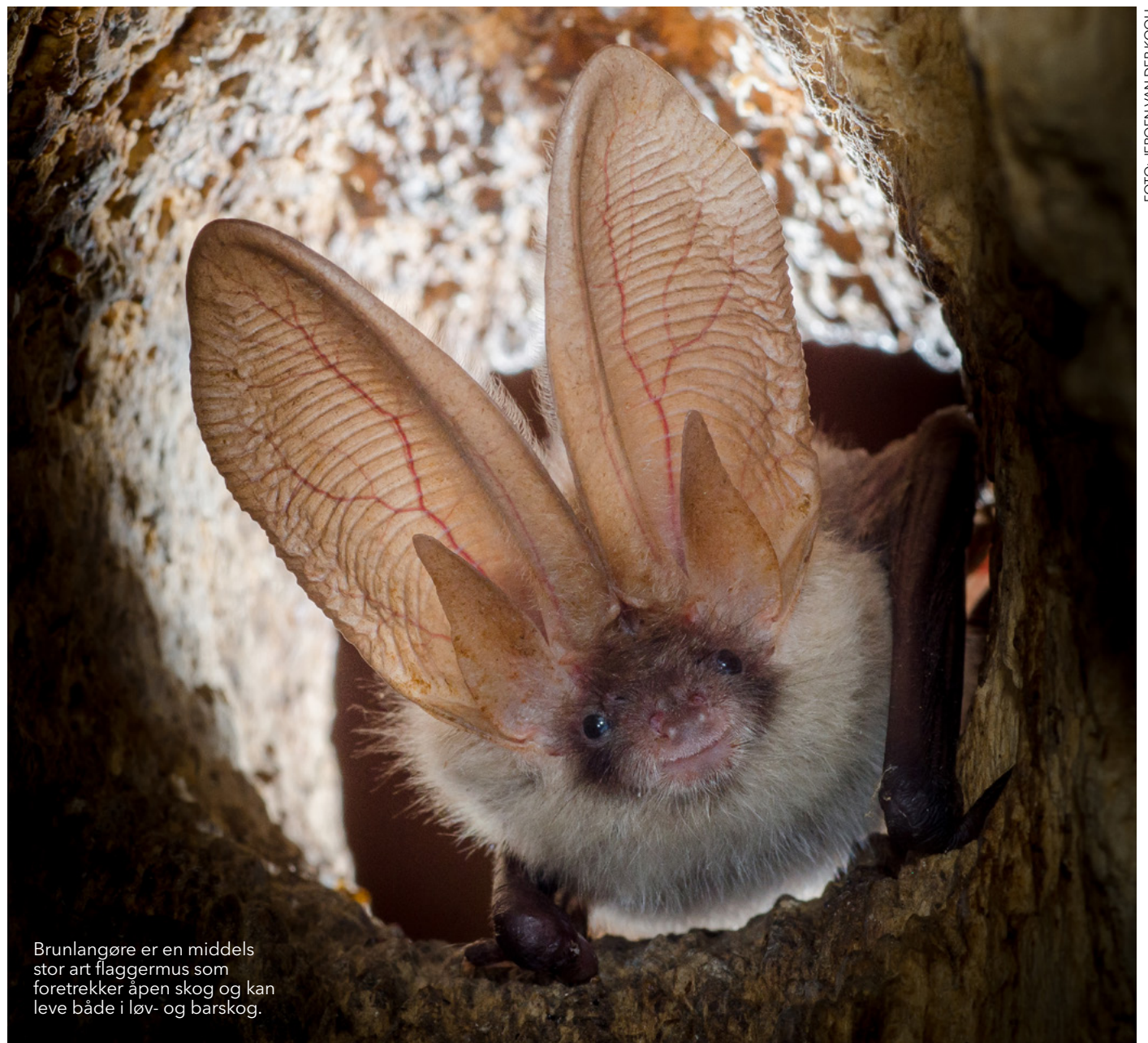
Brunlangøre er en middels stor art flaggermus som foretrekker åpen skog og kan leve både i løv- og barskog.

Nittedal har forpliktet seg til å jobbe for å nå FN's bærekraftsmål. Da trenger vi å tenke nytt i måten vi behandler naturen på. Dette har Nittedal MDG startet med, og fått viktige vedtak inn i handlingsplanen og samfunnsdelen av kommuneplanen. Samarbeid er nøkkelen til resultater. (Se egen sak om hva vi har fått til).