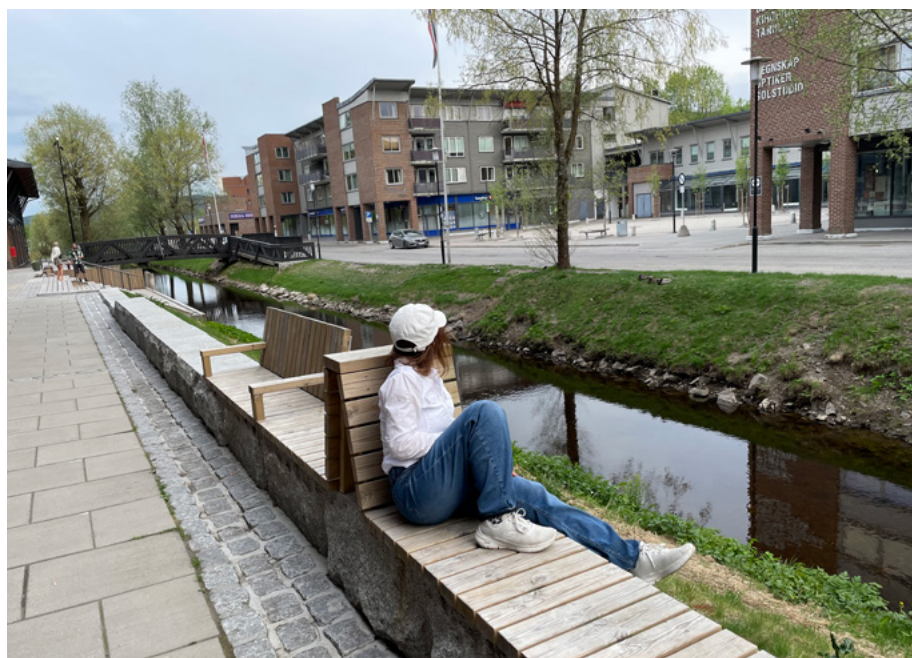
FLERE STEDER Å BENKE SEG: Sentrum trenger flere benker som gir folk mulighet til bare å sette seg ned og bare være. Alene eller sammen.

der ungdommene våre kan ta seg en pust i bakken, selv om det er helt uaktuelt for dem å leke på lekestativet de henger over.