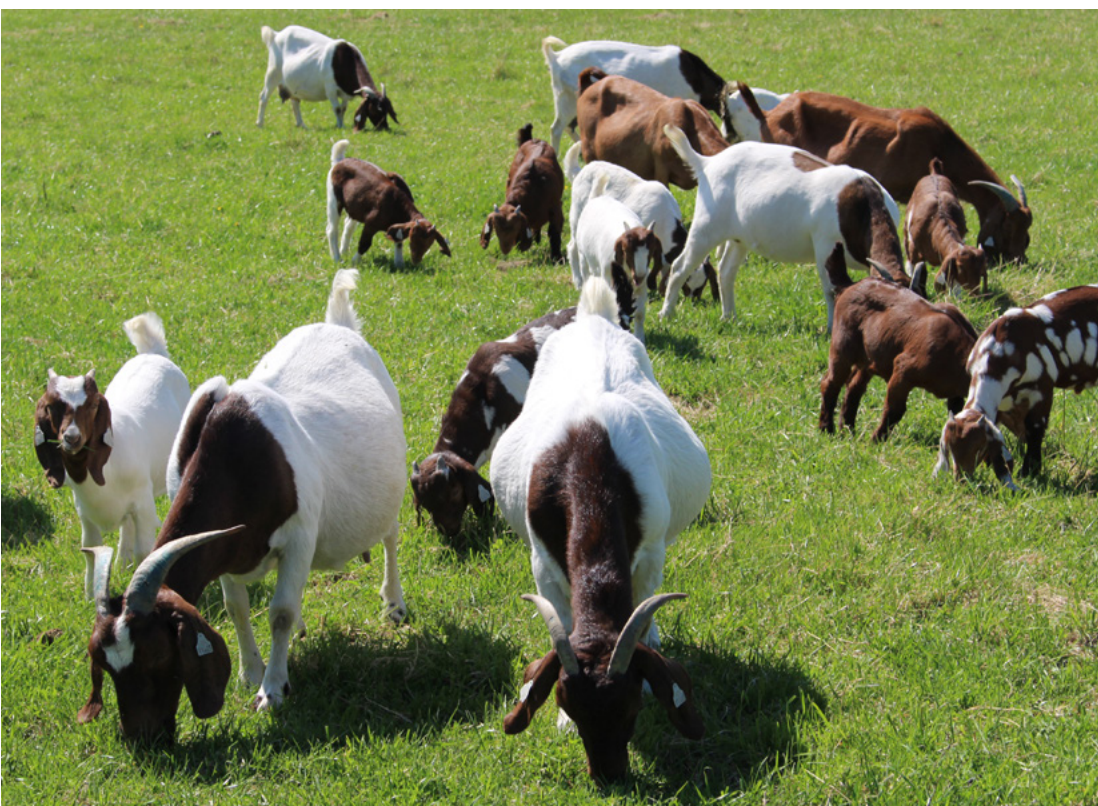
LÆRING PÅ GÅRD: Studier viser at bruk av gård som sted for læring kan styrke elevers motivasjon, øke læringsutbyttet og bygge identitet.

Så selv med en relativt god svangerskapsoppfølging, er det fortsatt behov for forbedringer. ■