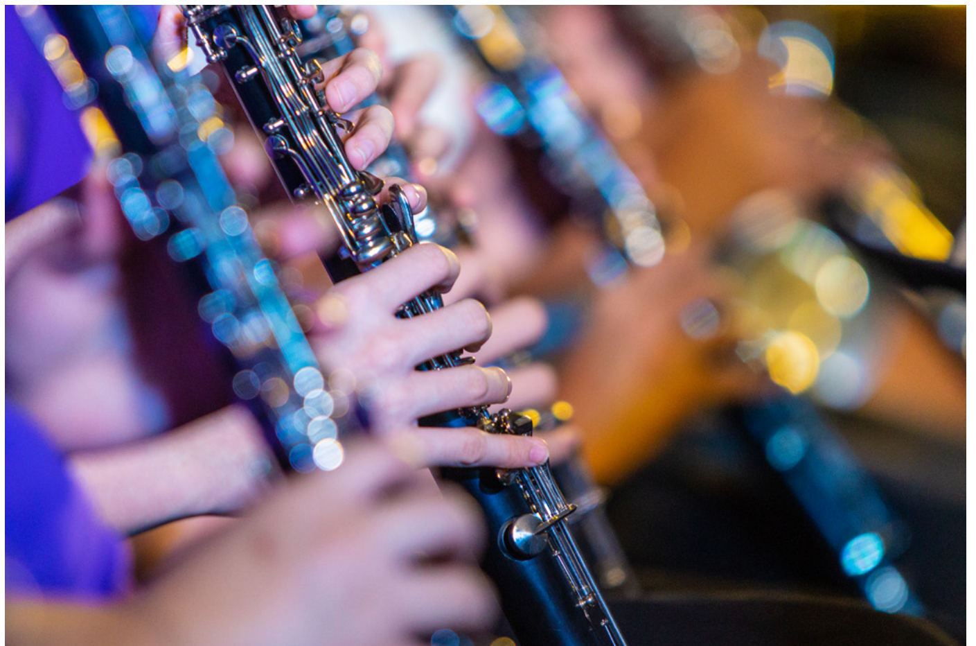
MER TIL KULTUR: Man kan ikke basere all fritidsaktivitet på frivillighet, og Nittedal trenger mer penger på fritidstilbudet til barn og unge, inkludert kulturtilbudet. ILLUSTRASJONSFOTO: COLOURBOX

Det kommende valget er avgjørende for en hel rekke byggeprosjekter og arealplanlegging. Hvis du ønsker at Nittedal skal være et fint sted å bo og leve, håper vi du tenker godt gjennom hva de forskjellige partiene har lyst til å gjøre med mulige sosiale møteplasser. Vi i MDG har lyst på koselige torg der du kan ta en brus mens ungene og besteforeldrene kan leke sammen, uten fare for å bli påkjørt. Steder