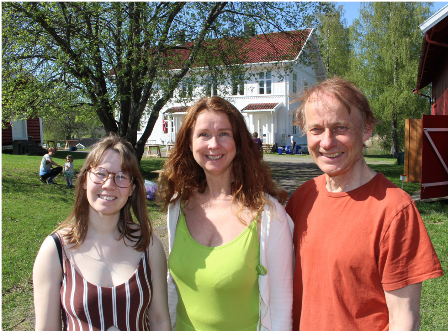
VERN: Bygdetunet ved Hagen skole skulle selges. Kirkene råtner på rot. Siden 1975 har over 30 prosent av viktige kulturminner i Nittedal gått tapt. - Kjennskap til Nittedals historie betyr mye for innbyggernes felles identitetsfølelse, påpeker MDG, som vil ha med fortiden inn i framtiden.