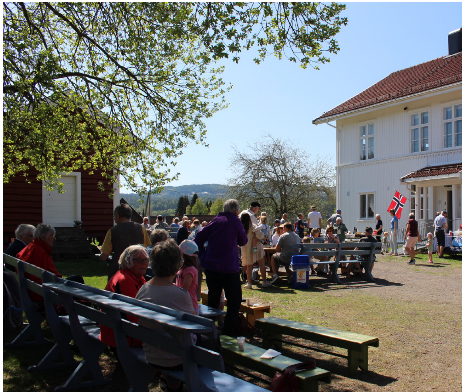
FOLKSOMT: Nittedøler strømmet til 1880-bygget da det ble invitert til familiedag på bygdetunet i mai.

Et høyaktuelt eksempel på vern av viktige bygninger er 1880-bygget på Hagen skole, et kulturminne som holdt på å gå tapt i november 2022. Kommunen ville gjøre det om til en privatbolig og selge det. MDG